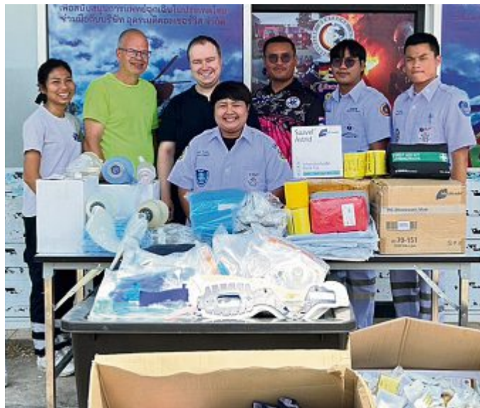
Die Deutsche Rettungsdiensthilfe überreicht die Spenden an eine Wache in Thailand.

In Deutschland gibt es die Regelung, dass alle medizinischen Verbrauchsartikel mit einem Verfallsdatum ausgezeichnet sind. Bis zu diesem Zeitpunkt übernimmt der Hersteller dafür eine Garantie, danach darf es nicht mehr benutzt werden, obwohl es trotzdem noch brauchbar ist. „Wir bekommen diese oft von Firmen und Institutionen mit kurzer Haltbarkeit und kümmern uns dann darum, dass diese noch genutzt werden können. Somit können hier medizinische Hilfsgüter vor der Entsorgung gerettet werden und Hilfsorganisationen vor Ort mit Material unterstützt werden“ betont Scherf